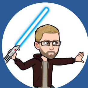
Marcus Lord of Numbers