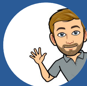
André Master of Cyberspace