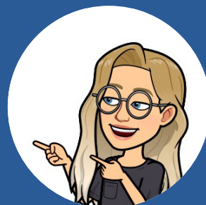
Malin Captain of Content